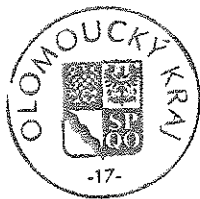
Ing. Zdeněk Švec náměstek hejtmána Olomouckého kraje